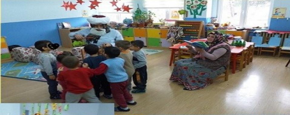
NASRETTİN HOCA -PARAYI VEREN DÜDÜĞÜ ÇALAR